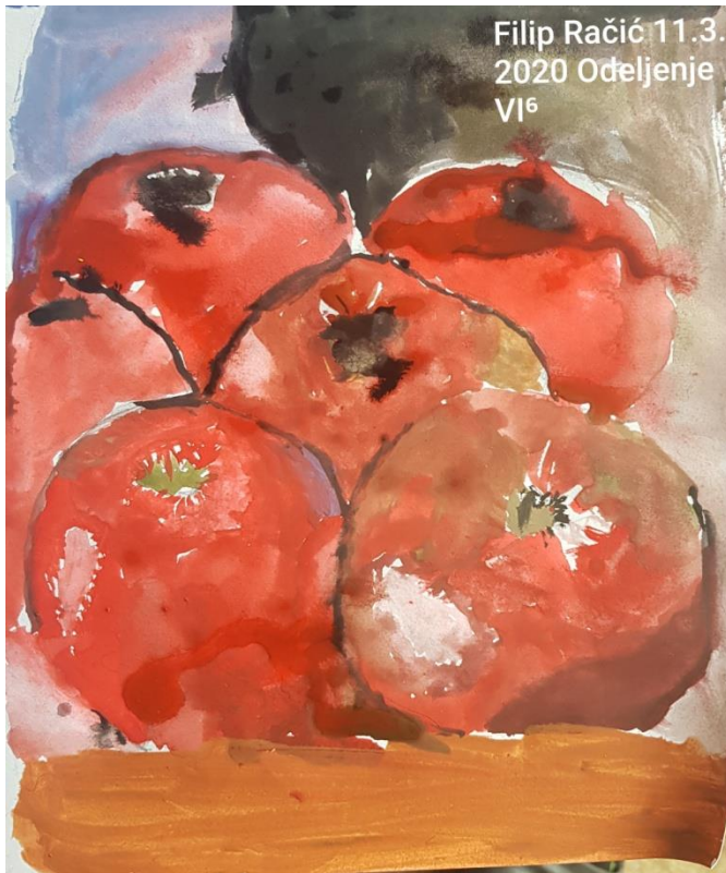
Филип Рачић 6-6