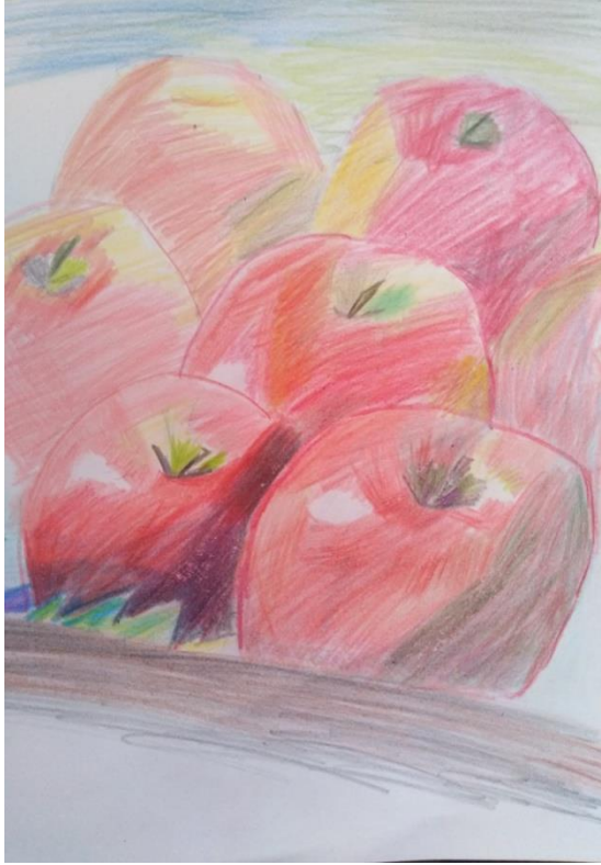
Бојана Срнић 6-5